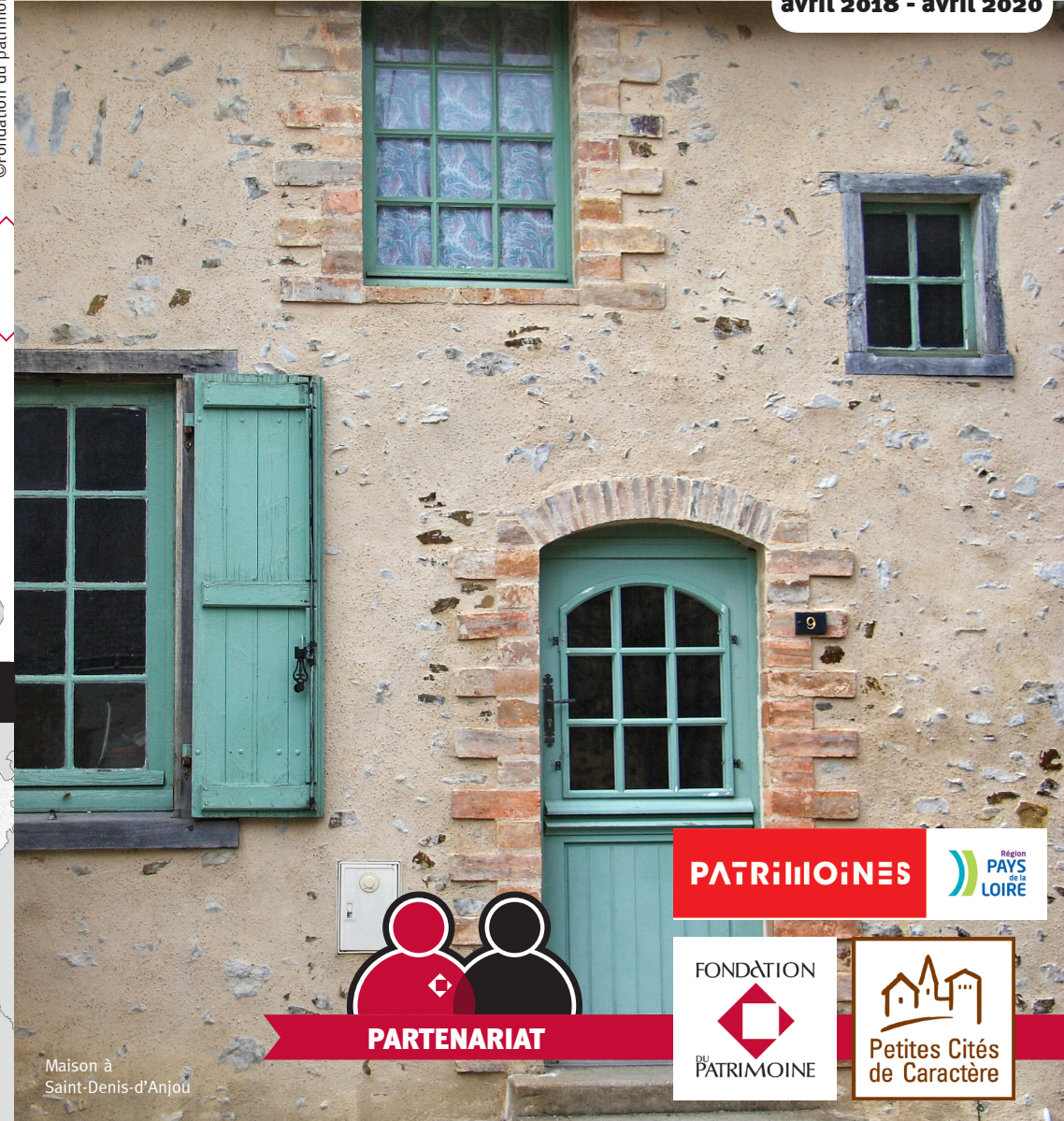
Maison à Saint-Denis-d'Anjou

©Fondation du patrimoine - Petites Cités de Caractères® - 05/18